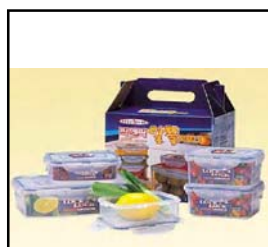
SET 5 PIEZAS