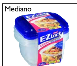
Ancho: 16.1 cm Alto: 8.6 cm Profundo: 14.5 cm