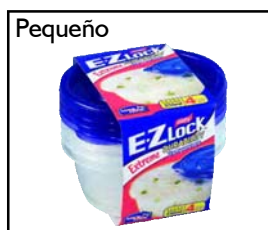
Diámetro: 12.6 cm Alto: 5.6 cm