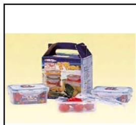
SET 3 PIEZAS