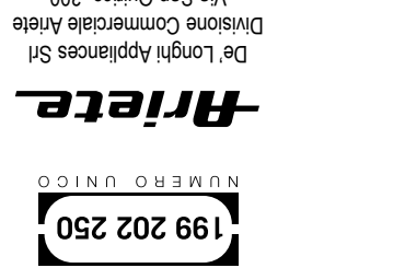
Internet: www.ariete.net E-Mail: info@ariete.net 50013 Campi Bisenzio - FI - Italy Via San Quinto, 300 Divisione Commerciale Ariete